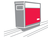
Transport par valisettes